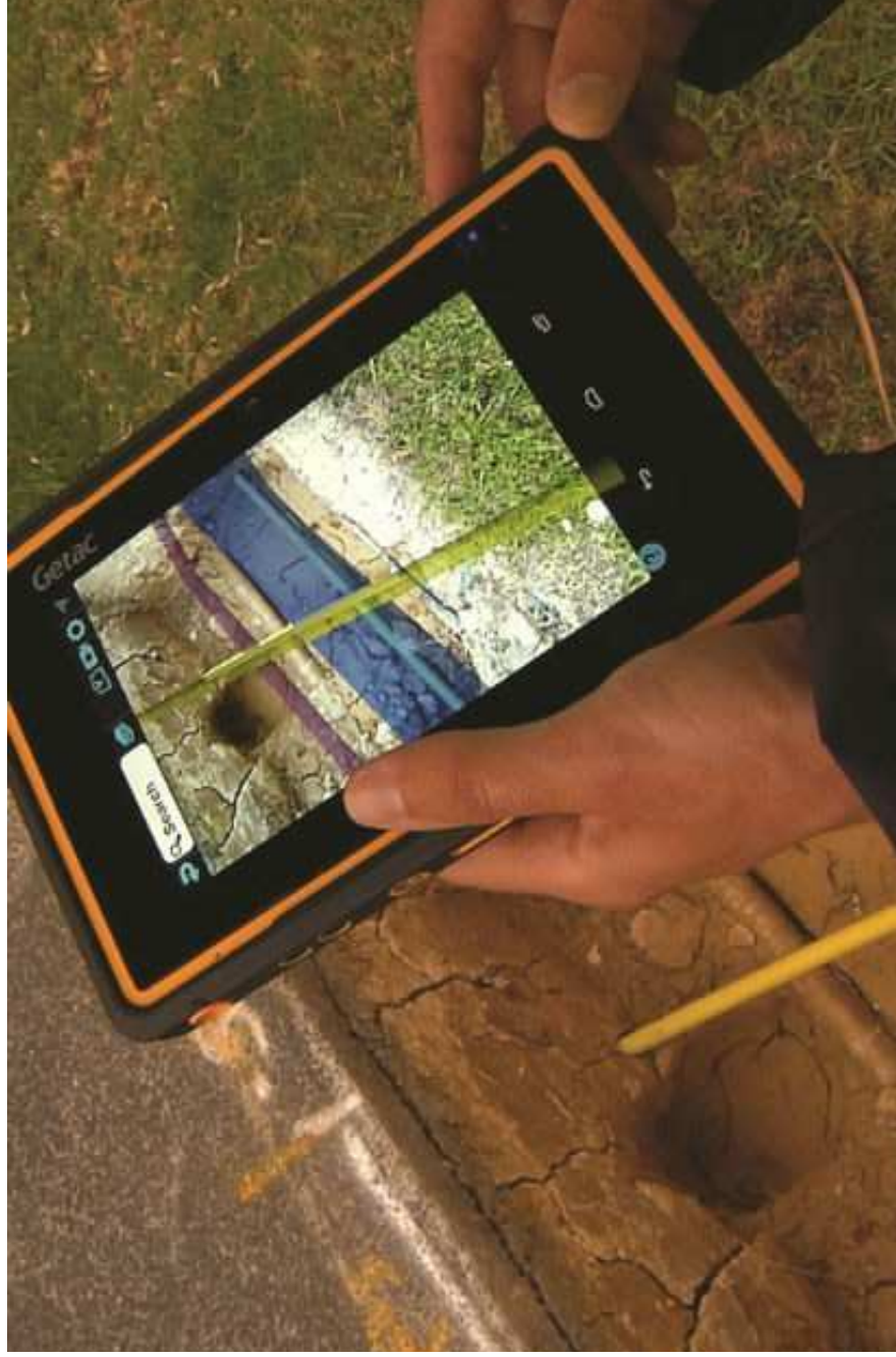
Rysunek 2. Przykład wykorzystania "rozszerzonej rzeczywistości" do podglądu przebiegu sieci uzbrojenia