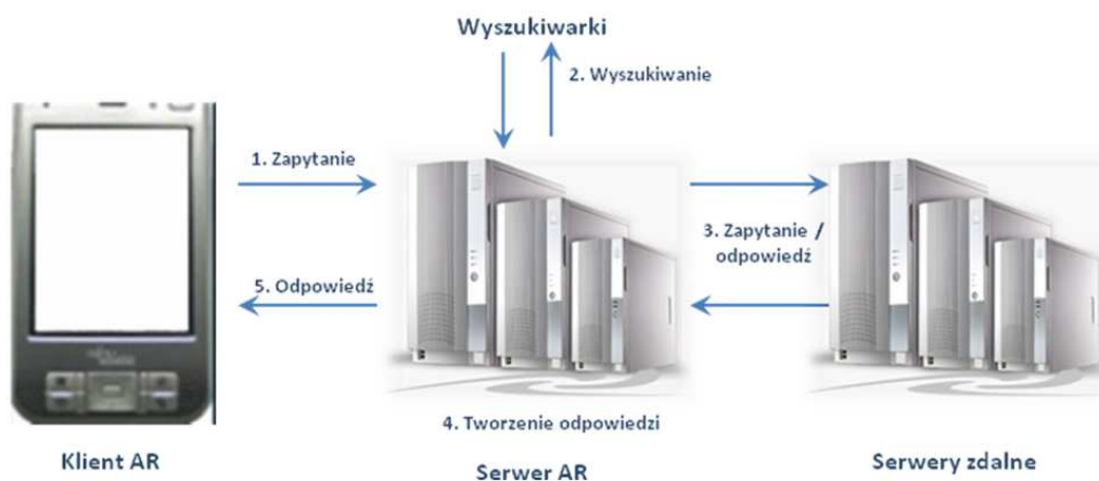
Rysunek 4. Przykładowy proces interakcji klienta AR z serwerem AR

Dodawanie nowej treści odbywa się w czasie rzeczywistym i związane jest z aktualnym kontekstem (zmianami środowiska), na przykład prezentacja wyników sportowych podczas meczu. Zaawansowane wykorzystanie rzeczywistości rozszerzonej pozwala, stosując dowolne urządzenie mobilne z wbudowaną kamerą, rozpoznać obiekt, a następnie nałożyć na obraz rzeczywisty interaktywne elementy (warstwy). Dzięki temu można uzupełnić rzeczywistość o dodatkowe informacje o oglądanym obiekcie, interesujących miejscach w pobliżu itp.