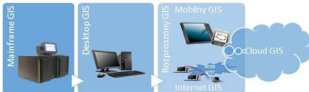
Rysunek 1. Etapy rozwoju systemów geoinformacyjnych

ważniejszych trendów mających wpływ na rozwój oprogramowania geoinformacyjnego zaliczyć można przede wszystkim (Goodchild, 2010):