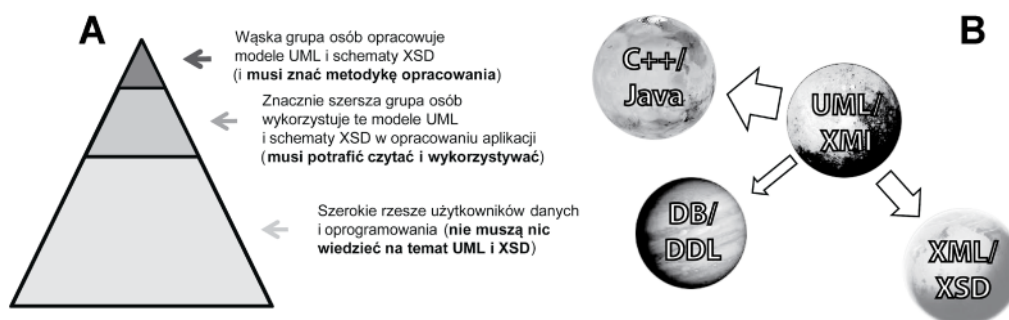
Rys. 1.1. A – Schematyczna piramida przedstawiająca udział poszczególnych grup uczestników prac dotyczących budowy krajowej infrastruktury informacji przestrzennej. B – Symboliczne przedstawienie różnic pomiędzy platformami projektowania i implementacji stosowanymi do danych geoprzestrzennych.

Rysunek 1.1B symbolicznie przedstawia różnice pomiędzy platformami projektowania i implementacji stosowanymi do danych geoprzestrzennych. Trudno jest znaleźć wspólną płaszczyznę i wspólne elementy dla różnych środowisk realizacji projektów informatycznych – zarówno niezależnych od platformy (język UML) jak i zależnych od platform implementacyjnych. Dotyczy to zakresu obiektowości, mechanizmów dziedziczenia, zagnieździeń