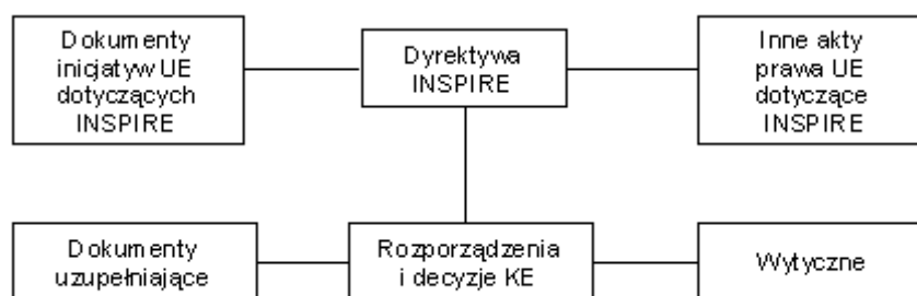
Rys. 1. Dyrektywa INSPIRE powiązana jest z innymi aktami i dokumentami unijnymi, a wynikającym z niej rozporządzeniom i decyzjom towarzyszą wytyczne i inne dokumenty uzupełniające

(z ich późniejszymi zmianami) oraz odwołująca się do inicjatyw wspólnotowych, takich jak programy GMES i Galileo (rys. 1).